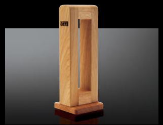
●イヤースピーカースタンド HPS-2 ¥5,550 (本体価格)

Top-of-the-line electrostatic earspeaker SR-009 規格 ●形式：プッシュプル・エレクトロスタティック（静電型）大型円形発音体後方解放型エンクロージャー ●再生周波数帯域：5-42,000Hz ●静電容量：110pF（附属ケーブル含む） ●インピーダンス：145k \Omega （10kHzにて附属ケーブル含む） ●音圧感度：101dB/100Vr.m.s. 入力/1kHz ●最大音圧レベル：118dB/400Hz（ドライバーユニットに依存） ●成極電圧：580V DC ●左右（LR）表示：本体およびアーク部に L、R の表示、ケーブルに金色の実線（L）、点線（R）の表示、本体とケーブル接合部に L、R 表示 ●イヤークッション：肌に触れる部分と周囲部分：本革、取付部分：高級人工皮革 ●ケーブル：平行 6 芯、全長 2.5m、特製幅広低容量ケーブル、ケーブル材質：6N（99.9999%）OFC+銀コーティング ●重量：596g（附属ケーブル含む）、454g（本体のみ）