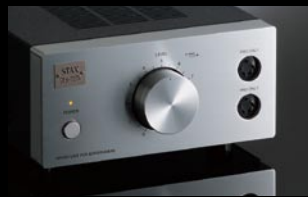
●ドライバーユニット SRM-727A ¥132,000(本体価格)