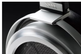
●アルミ削り出しエンクロージャー