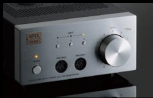
●ドライバーユニット SRM-007tA ¥147,000 (本体価格)