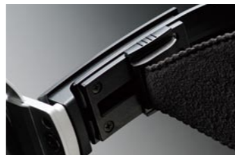
●10ステップ位置調整機能付きアーク