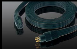
●銀コート 6N Cu 延長ケーブル SRE-950S (5m) ¥8,000 (本体価格) SRE-925S 2.5m ¥16,000 (本体価格)