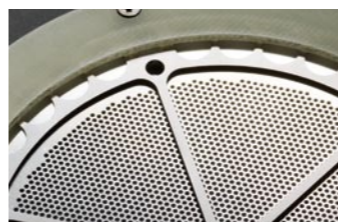
●新開発大型円形MLERサウンドユニット