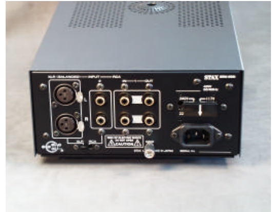
SRM-006 t リアパネル