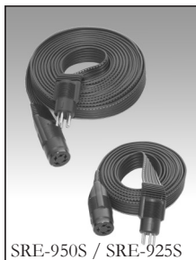
SRE-950S / SRE-925S